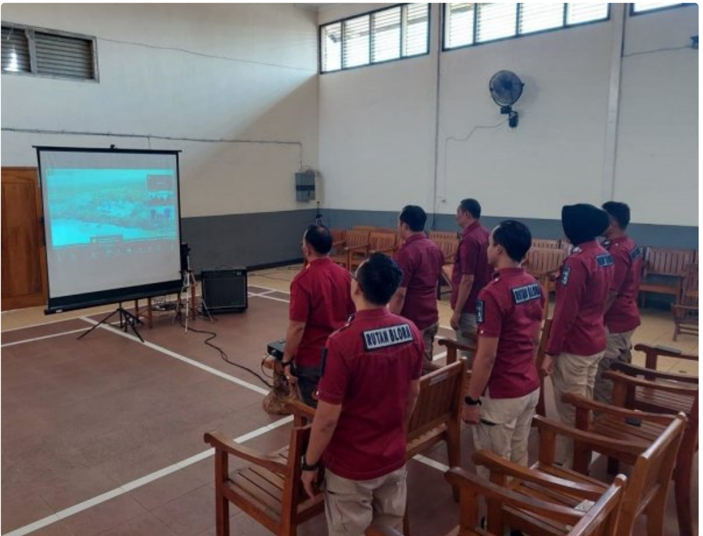
Rutan Blora Ikuti Webinar Series 5 Bersama BPSDM Hukum dan HAM

Blora – Rumah Tahanan Negara (Rutan) Kelas IIB Blora Kantor Wilayah Kementerian Hukum dan Hak Asasi Manusia (Kemenkumham) Jawa Tengah mengikuti Webinar Series 5 bertema “Powerful Coaching, Mentoring, dan Counseling untuk Perubahan Organisasi dan Pengembangan Kompetensi ASN.” Kegiatan yang diadakan oleh Badan Pengembangan Sumber Daya Manusia